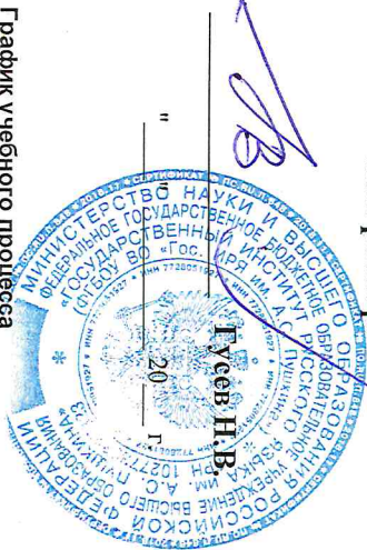
График учебного процесса